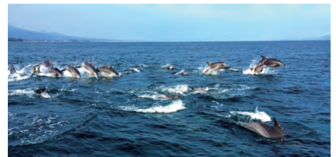
1年を通じて90%以上の遭遇率! 100頭以上の群れに出合えることもあります。